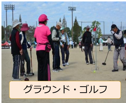
グラウンド・ゴルフ